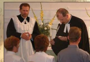
Istentisztelet a szlovák gyülekezetben

Talán ezért is vagyunk valahányan szkeptikusak bármilyen új láttán, főleg ha szerintünk reménytelennek is tűnik az egész. Budapesti Szlovák gyülekezet – már a név is kicsit elrettentőnek tűnik a mai politikai és társadalmi közhangulatot ismerve. Innen, Magyarországról Trianon sebeit nyalogatva, irigykedve és igazságérzetünk teljes tudatában értékeljük a szlovák államiság létjogosultságát. Onnan, Szlovákiából pedig a jogos önrendelkezés és nemzeti függetlenség jegyében nem értik a határon túli indulatokat.