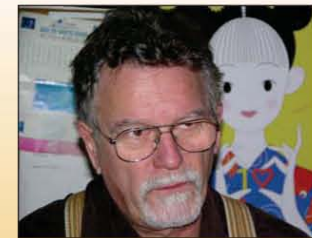
Jankovics Marcell, rajzfilmrendező

Ez nem ilyen egyszerű. Egyrészt – talán furcsa, de – pénz-, illetőleg hatalomfüggő. Három változat lehetséges: